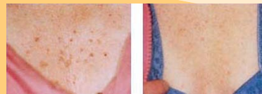
Laser pour le traitement des lentigos (1 à 2 séances)

Un traitement rapide en une à deux séances.