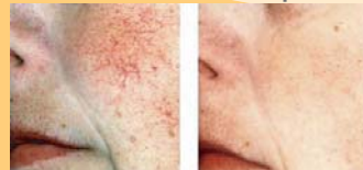
Varicosités du visage, de l'aile du nez, couperose