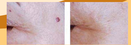
Ablation par laser des taches rubis et des angiomes