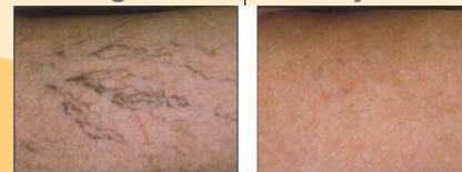
Varicosités des cuisses et des membres inférieurs