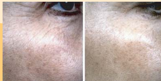
Réduction des rides du coin de l'oeil par laser KTP

Les yeux sont protégés durant la phase de traitement du visage.