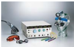
Laser de réjuvenation

Le résultat conduit à un aspect plus jeune du teint et une diminution des rides et ridules.