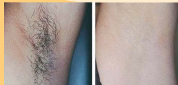
Epilation progressivement définitive

Il faut raser la zone à épiler 2 jours avant la séance.